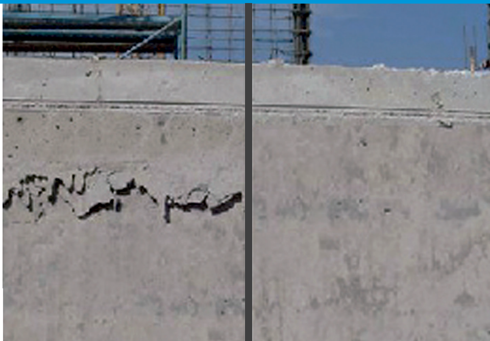
SIN MAXTAPE MOLDAJE